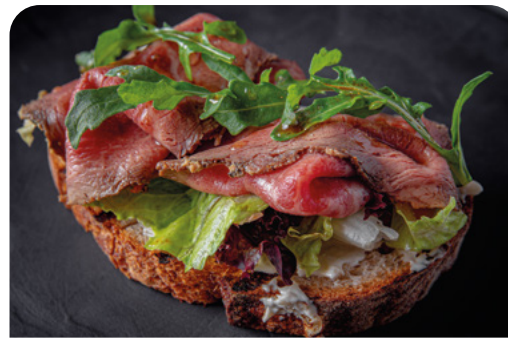
БРУСКЕТТА С РОСТБИФОМ BRUSCHETTA WITH ROAST BEEF

145 г ..... 690 Нежное мясо говяжьих щечек мраморных бычков с салатом «Коул-Слоу» и перцем гриль, авокадо и пармезаном.