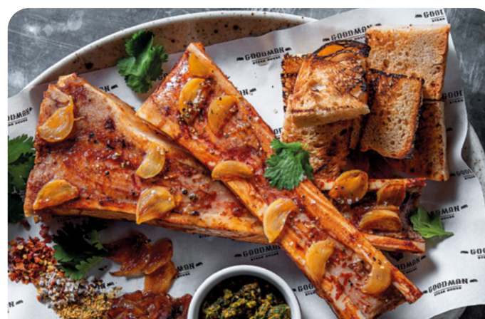
МОЗГОВЫЕ КОСТОЧКИ НА ГРИЛЕ GRILLED MARROW BONES

290/100/30 г ..... 790 В глазури «Барбекю». Подаются со свежей морковью, сельдереем и соусом «Блю чиз».