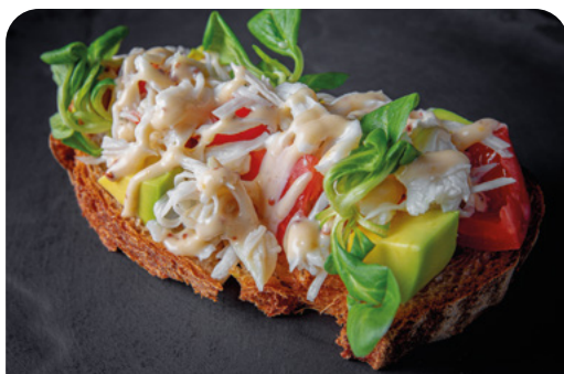
БРУСКЕТТА С КРАБОМ BRUSCHETTA WITH CRAB

125 г ..... 870 Обжаренный на гриле гречишный хлеб с краб-миксом, сочными томатами и авокадо под медово-горчичным соусом.