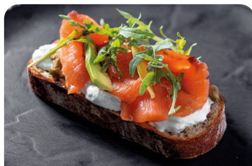
БРУСКЕТТА СО СЛАБОСОЛЕННОЙ СЕМГОЙ BRUSCHETTA WITH LIGHTLY SALTED SALMON

125 г ..... 870 Обжаренный на гриле гречишный хлеб с краб-миксом, сочными томатами и авокадо под медово-горчичным соусом.