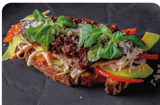
БРУСКЕТТА С ТОМЛЕННОЙ ГОВЯДИНОЙ BRUSCHETTA WITH STEWED BEEF

BRUSCHETTA WITH TOMATOES AND STRACATELLA 125 г ..... 590 Томаты со страчателлой, соусами песто и бальзамик на гречишном хлебе.